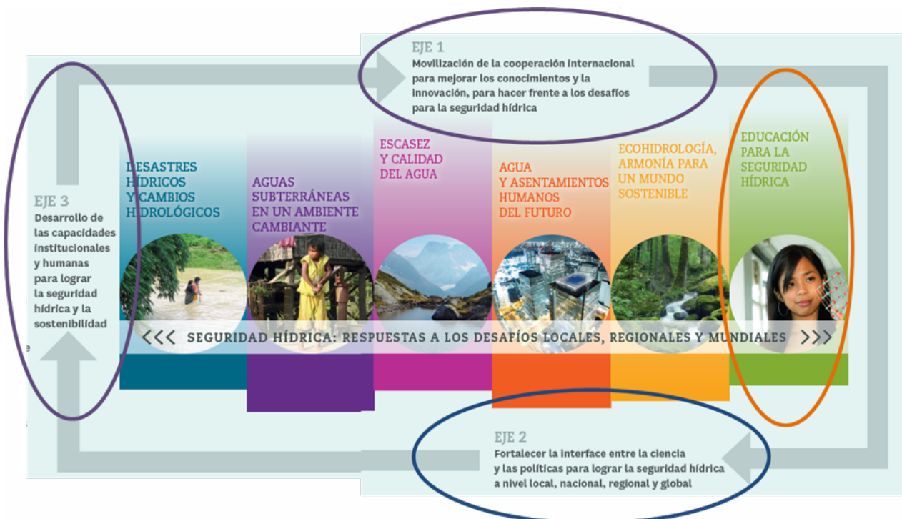
Ejes y Temas de la VIII Fase del Programa Hidrológico Internacional