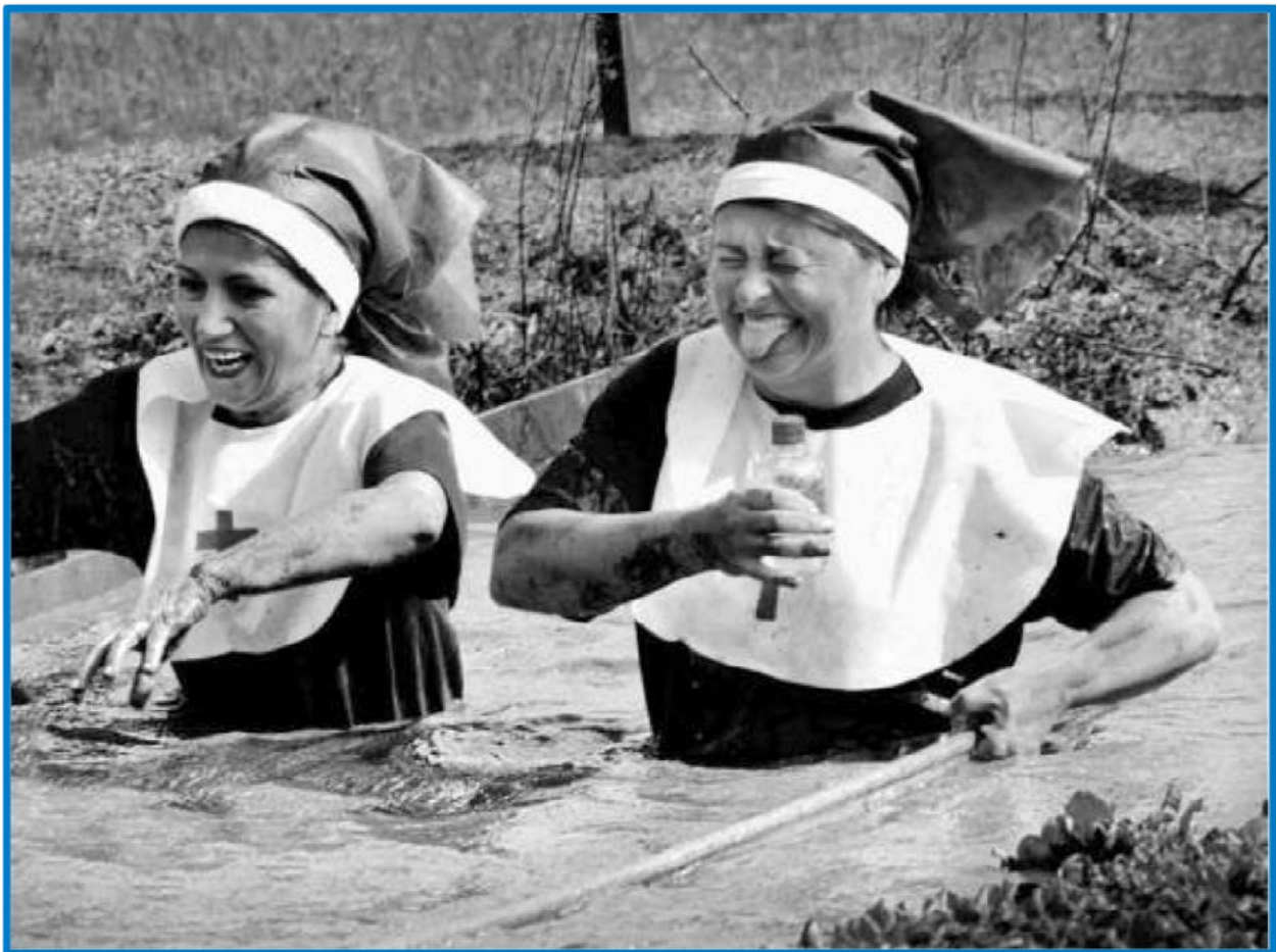
«Voluntad y esperanza», de José Glavic. Primer premio – VII Edición Concurso de Fotografías El agua en imágenes – 2017

en la naturaleza para hacer frente a los desafíos del agua”. La repercusión del concurso en la región y la importante cantidad y calidad de las fotografías recibidas ha promovido la realización de un libro con las fotografías más destacadas (Photobook). Ello constituirá sin duda un instrumento para la generación de conciencia acerca de los desafíos y responsabilidades que para el conjunto de la sociedad implica el uso racional y sostenible del agua y el diseño de medidas de prevención, adaptación y mitigación ante los riesgos asociados.